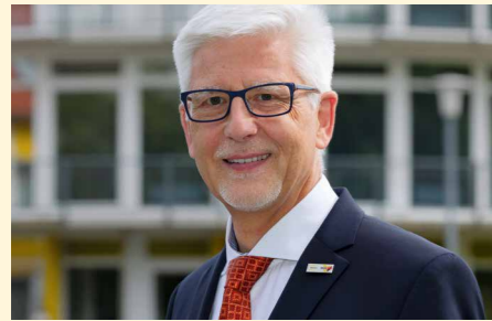
„Es braucht neue Antworten.“

was wir alle in den zurückliegenden Wochen und Monaten erlebt haben und wie sich auch die aktuelle Situation gestaltet, das hat in diesem Ausmaß und in dieser Dynamik niemand voraussehen können. Kein Lebensbereich ist von der Corona-Pandemie unberührt, jeder von uns spürt direkte Auswirkungen und muss mit mittelbaren Folgen umgehen.